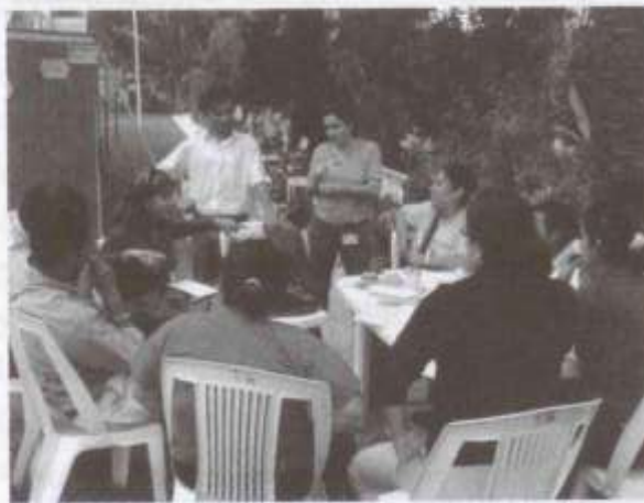
Jóvenes de México y Centroamérica, debatiendo en subgrupos de trabajo en el Foro Internacional de Democracia Social 2004 "Pobreza urbana y exclusión social, desafío común de México y Centroamérica en el siglo XXI, del 22 al 25 de junio de 2004.

En el año 2003 América Latina registró 225 millones de personas (44% de la población), cuyos ingresos se situaron por debajo de la línea de pobreza. 40 En el caso particular de México y los países centroamericanos los porcentajes de pobreza en el año 2001 fueron los siguientes: México 42,3%, Costa Rica 21,7%, El Salvador 49,9%, Guatemala 60,4%, Honduras 79,1%, Nicaragua 42,3% y Panamá 30,8%. 41