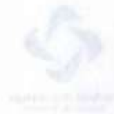
Foto de Jóvenes para la Democracia Social Cuestionario de Reflexiones

Primera edición, 2004 Fundación Friedrich Ebert. Representación en México Yautepec 55, Col. Condesa 06140 México, D. F. Tel.: 01 (55) 5553 53 02 Fax: 01 (55) 5254 15 54 fesmex@laneta.apc.org www.fesmex.org